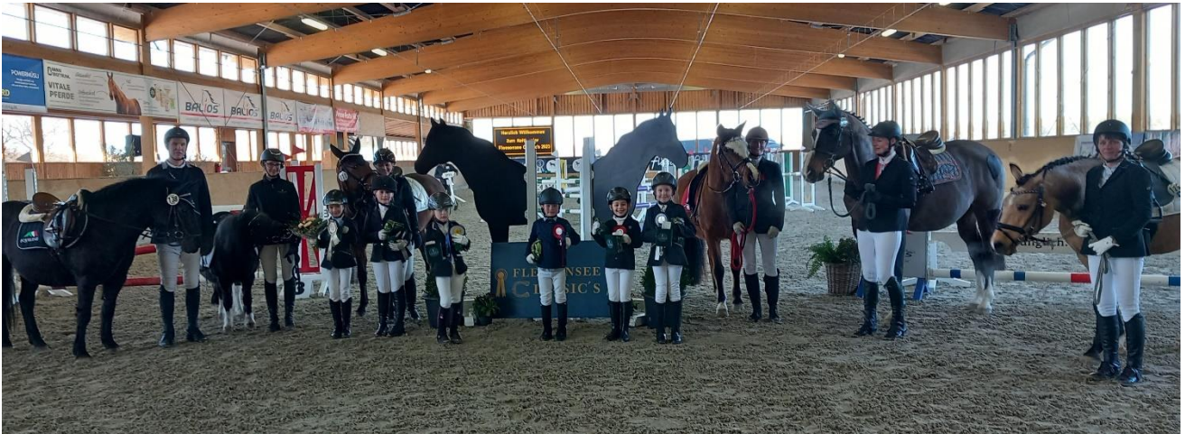
Foto: Bild der Sieger und Platzierten im Führzügelwettbewerb anlässlich der Fleesensee Future Days

Rostock (PSV MV). Seit Ende Januar haben das Team um Frau Höcker und Frau Drews verschiedene Turniere, die Fleesensee Classics ausgerichtet. Nachdem die Springreiter in den Genuß der Nutzung der Halle über mehrere Stationen kamen, die Dressurreiter am internationalen Frauentag die Anlage zum Einstieg in die Saison in Klasse A und L nutzten, haben am vergangenen Wochenende die Einsteiger in den Turniersport neben den Springern bei den Fleesensee Future Days diese Winterserie beendet. Neben dem Reiterwettbewerb standen auch der Führzügel und ein Kostümführzügelwettbewerb sowie zwei Springwettbewerbe auf dem Zeitplan, was mit strahlenden Kinderaugen dem Veranstalterteam honoriert worden ist.