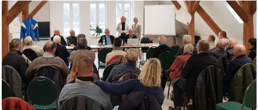
Foto: Blick in den Schulungsraum des Landgestüts Redefin bei den

Gesprächen über das Buch „Pferdesport in der DDR 1951-1990“.