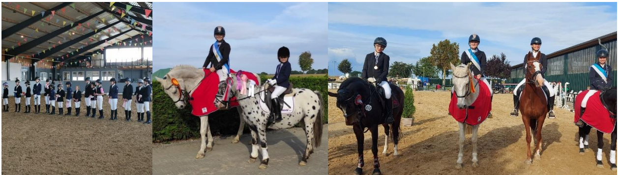
Fotos: Impressionen des vergangenen Reitertages in Elmenhorst